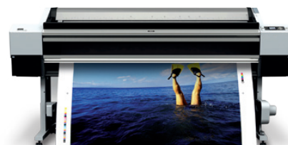
Epson Stylus Pro 11880