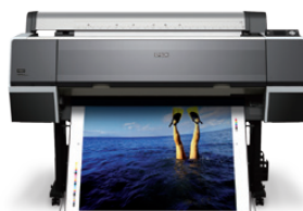
Epson Stylus Pro 9700